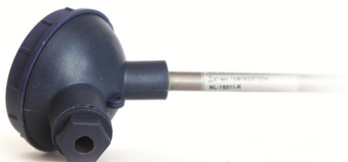
Рис.1. Внешний вид датчика

Функции опроса датчиков, преобразования аналоговых сигналов в цифровую форму и передачи данных по интерфейсу RS-485 выполняет контроллер ATMEGA8L.